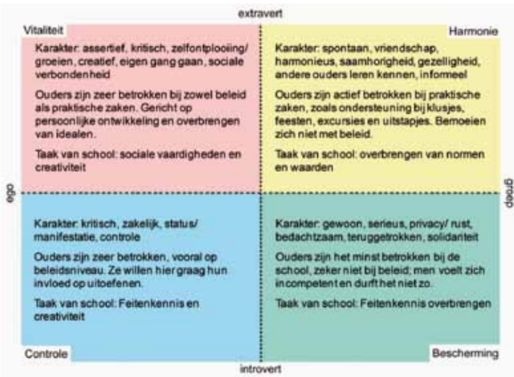
Figuur 1: Oudertypen in het BSR-model