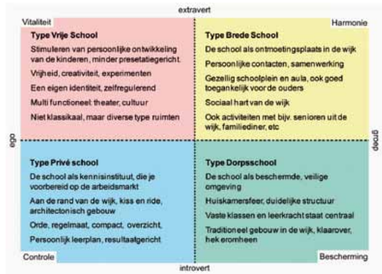
Figuur 2: Vier archetype scholen

SmartAgent heeft intensief onderzoek gedaan voor de onderwijsmonitor in opdracht van het ministerie van Onderwijs, Cultuur en Wetenschap. Hierin zijn verschillende oudertypen en hun betrokkenheid bij de school onderscheiden. In figuur 1 worden de groepen kort beschreven.