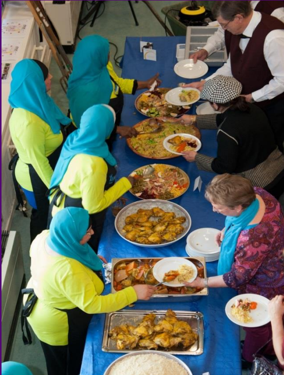
Wijkrestaurant, zalen verhuur & catering