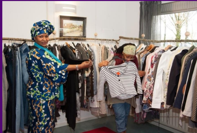
Kleding- en naaiatelier