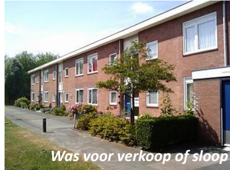
Was voor verkoop of sloop

Nu 500 units (prefab) Voor studenten en vergunninghouders Door inzet reeds gebruikte units