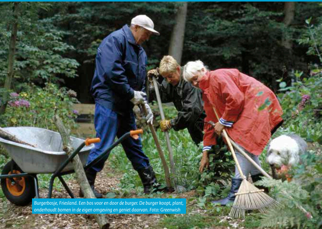
Burgerbosje, Friesland. Een bos voor en door de burger. De burger koopt, plant, onderhoudt bomen in de eigen omgeving en geniet daarvan.

Niet alleen bijdragen in de tekst, maar ook de illustraties zijn het resultaat van coproductie met maatschappelijke organisaties, waarvoor dank.